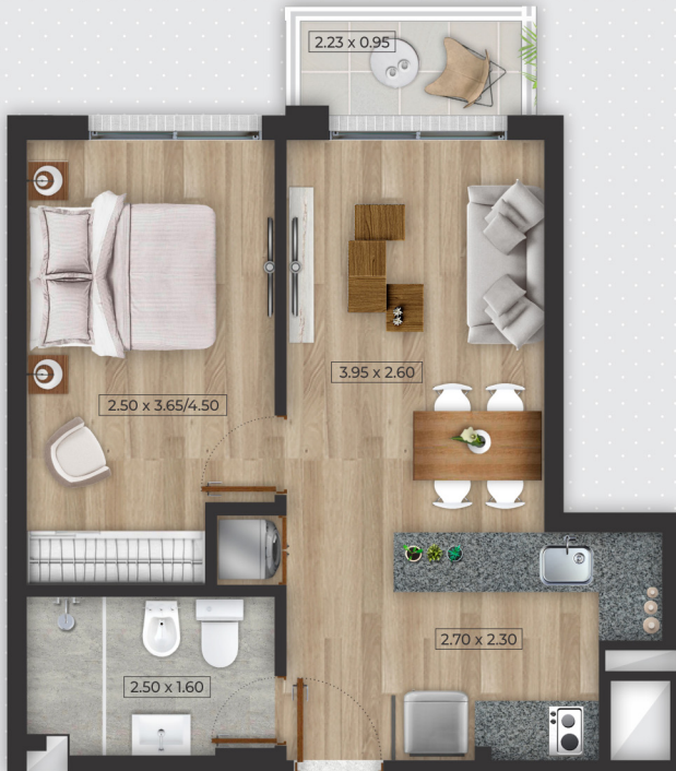
Placares no incluidos en dormitorios