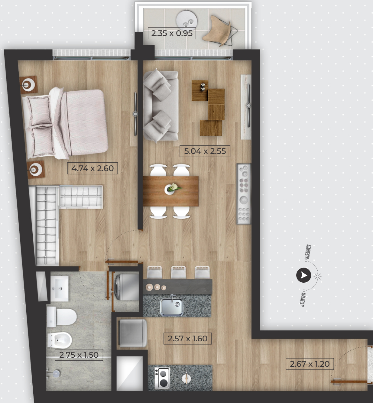
Placares no incluidos en dormitorios

TÉRMINOS LEGALES: La presente información es preliminar, orientativa y no vinculante, quedando sujeta a las modificaciones que por causas técnicas, naturales o impuestas por las autoridades pertinentes pudieran ocurrir al ajustar el proyecto definitivo. Las imágenes pueden presentar diferencias con la versión final real y las medidas definitivas surgirán del plano a realizar por el Ing. Agrimensor. La Dirección de Obra se reserva el derecho, en forma unilateral y en cualquier momento, a modificar las terminaciones que figuran en las ilustraciones, sin ir en detrimento del diseño ni de la calidad. El mobiliario y equipamiento son de carácter ilustrativo y no forman parte de las unidades. Antes de adquirir unidades, solicite al vendedor/promotor la información técnica necesaria a efectos de confirmar los datos obtenidos y poder tomar una decisión informada. Las áreas están consideradas según los criterios de APPCU.